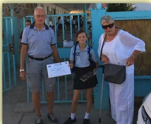
De trotse oma en opa met kleindochter